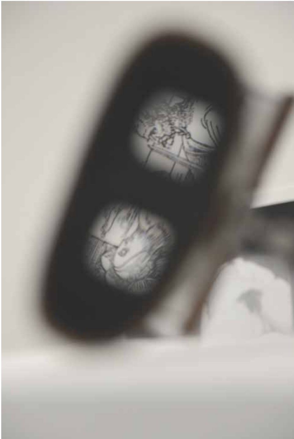
resolution in = out stereoskop / dürer / der zeichner des liegenden weibes