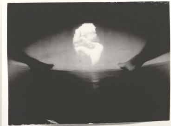
resolution in / out yonicam / duchamps / étant donnés