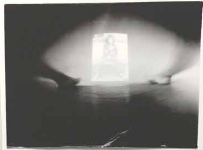
resolution in / out yonicam / EXPORT / aktionshose: genitalpanik